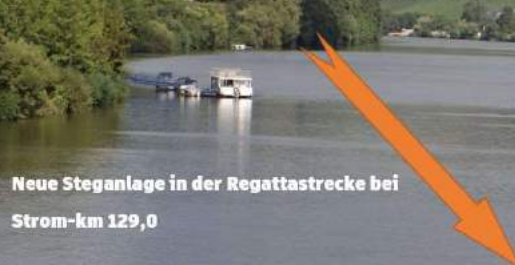
Neue Steganlage in der Regattastrecke bei Strom-km 129,0