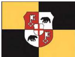
Bernkasteler Ruderverein 1874 e.V.

Erstmals nach Corona bieten wir in 2023 wieder eine Abendveranstaltung im großen Regattazelt an. Genießen Sie nach dem sportlichen Wettkampf unsere guten Weine, die Musik im Regattazelt und die Gemeinschaft der Ruderer beim Regattaabschluss.